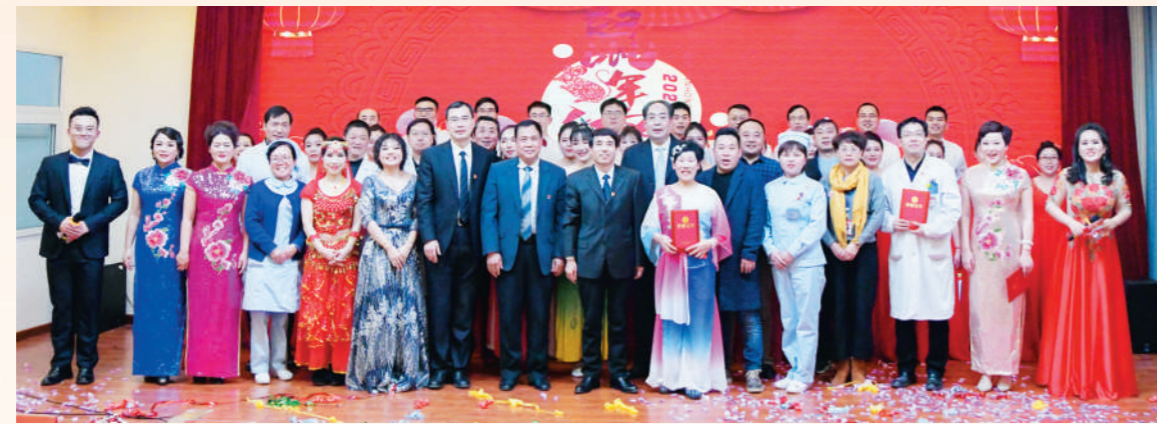
院领导与演职人员合影留念