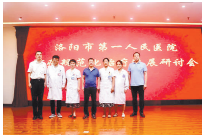
作出谋划策。相信通过大家平将会有新的更大的提升。共同努力,我院肺癌诊治水 (肿瘤内科)

肿瘤内科三位青年医师以实际案例为出发点带来了病例分享。院长苗润宏在总结讲话时指出,此次会议专家结合实践提出了许多建设性的临床见解,丰富了临床医师的思维,不仅增进了专业医务人员之间的学术交流,还为今后医院更好的开展规范化治疗工